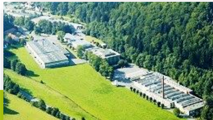
Plant Frankenhammer / Gaskets & Administration